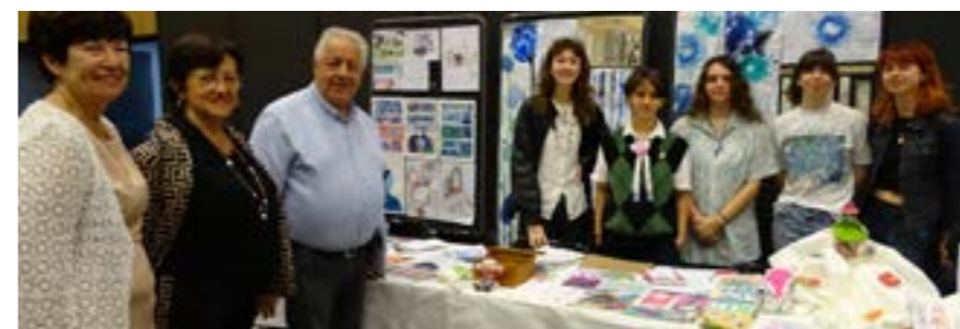
Le Salon fut aussi pour les élèves du lycée Goscinny de Drap de vivre leur première exposition ! Merci à tous les exposants !