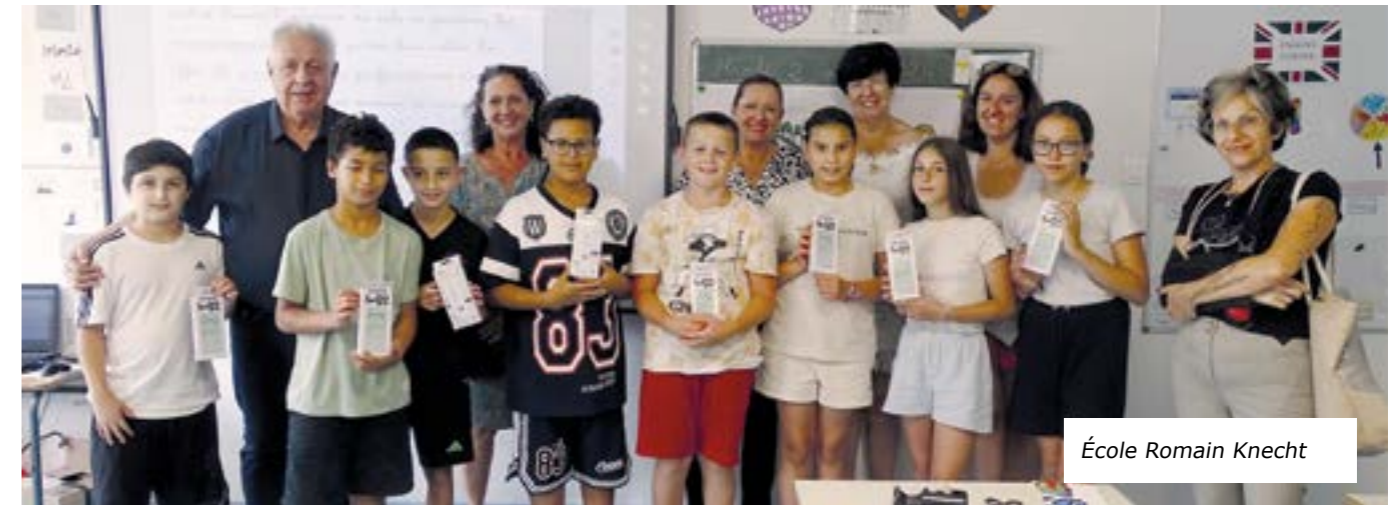
École Romain Knecht