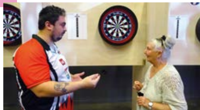
Organisée par la Fédération nationale des associations de directeurs d'établissements & services pour personnes âgées il s'agissait de la première compétition sportive entre personnes aidés et aidants professionnels des établissements du secteur social et médico-social dans les Alpes-Maritimes. Bravo à l'ADMR de Drap et à Drap Darts pour leur investissement et leur expertise !