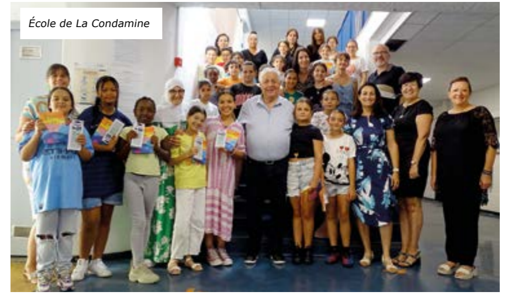
École de La Condamine