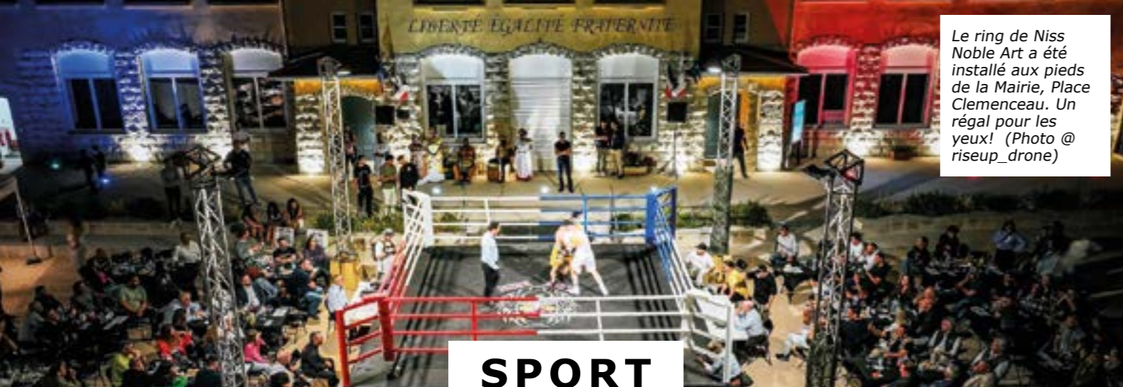
Le ring de Niss Noble Art a été installé aux pieds de la Mairie, Place Clemenceau. Un régal pour les yeux!