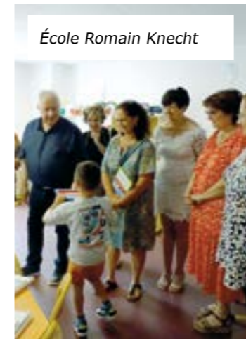
École Romain Knecht