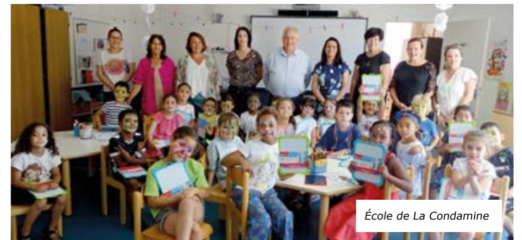
École de La Condamine