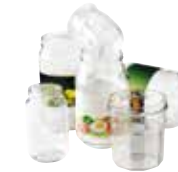
Pots et bocaux