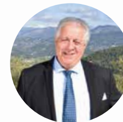
Christian ESTROSI Maire de Nice Président de la Métropole Nice Côte d'Azur Président délégué de la Région Sud Provence-Alpes-Côte d'Azur

Drap vit une étape importante pour son avenir. L'année 2022 marquera son histoire, celle de son entrée dans la Métropole Nice Côte d'Azur.