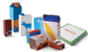
Emballages en carton et briques alimentaires