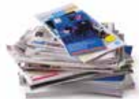
Prospectus, publicités, journaux, magazines, catalogues, annuaires