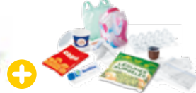
Les autres emballages en plastique