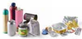
Emballages en métal (acier et aluminium)