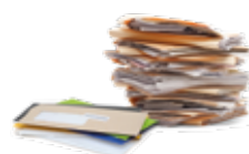
Enveloppes, livres, courriers, impressions, photocopies, cahiers